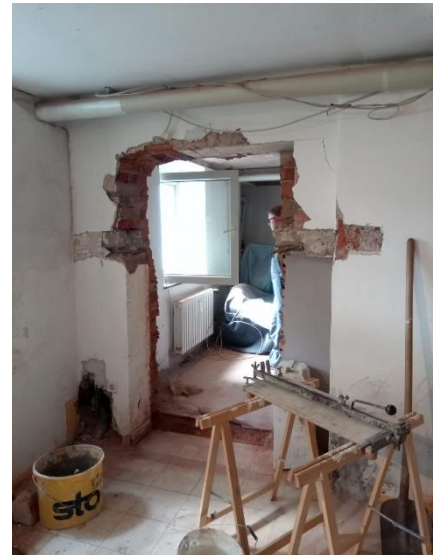
Durchbruch in das später noch entstehende Sozialwerk-Büro