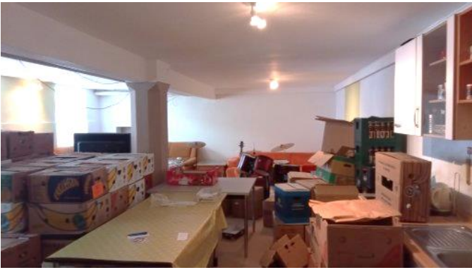
Vor dem Umbau